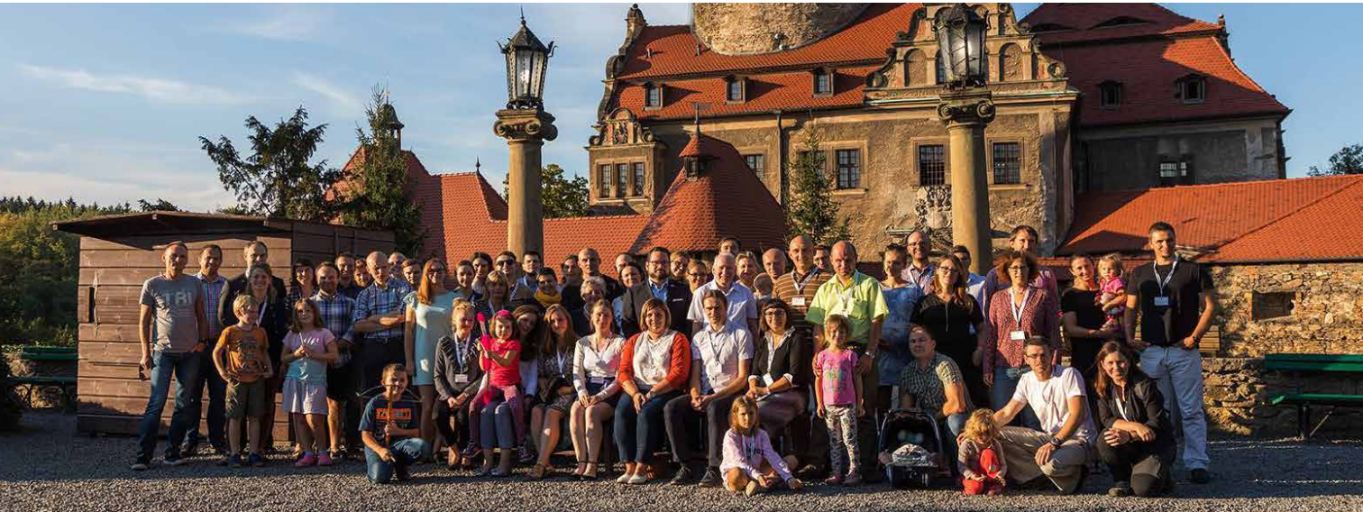
Polnische Fellows beim Alumni-Jahrestreffen

sowie weitere Treffen (z. B. Stammtische) in ihren Ländern, die auch für die Integration der zurückkehrenden Fellows in die Vereinigung dienen. Darüber hinaus führen sie internationale Fachveranstaltungen durch und pflegen eine länderübergreifende Zusammenarbeit. Die Alumni-Vereinigungen entsenden auch Vertreterinnen und Vertreter zu wichtigen DBU-Veranstaltungen nach Deutschland, z. B. alljährliche Verleihung des Deutschen Umweltpreises, Woche der Umwelt beim deutschen Bundespräsidenten, jährlicher internationaler Alumni-Workshop zum Austausch der Alumni-Vereinigungen untereinander.