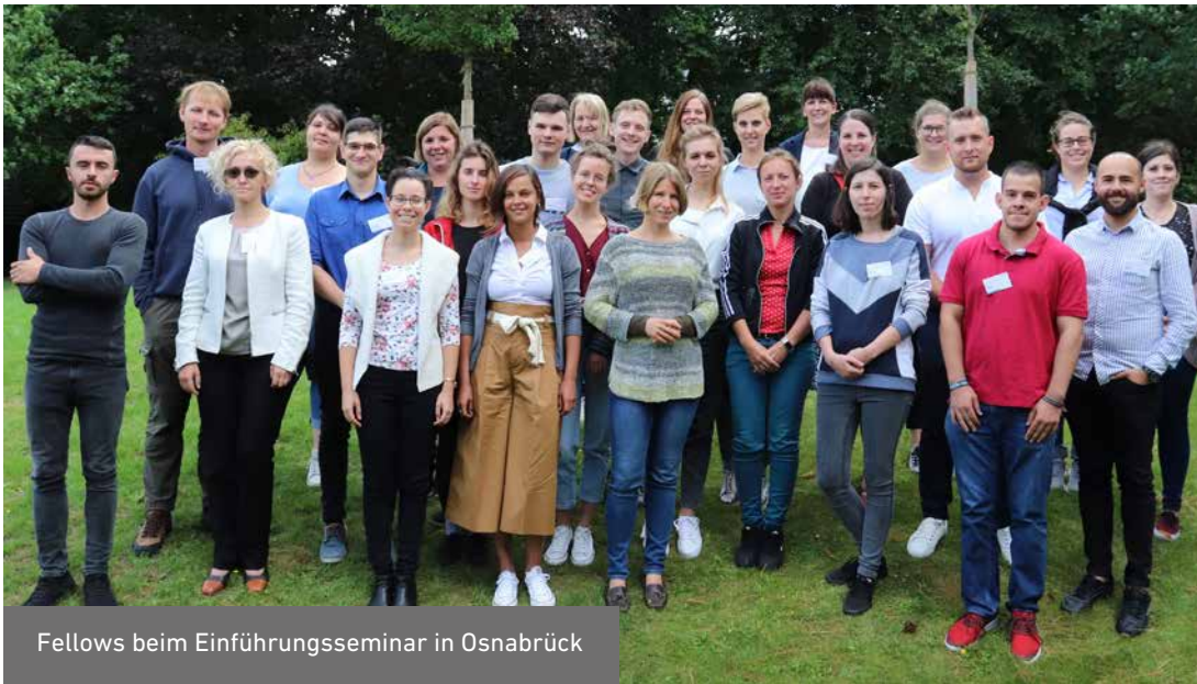
Fellows beim Einführungsseminar in Osnabrück