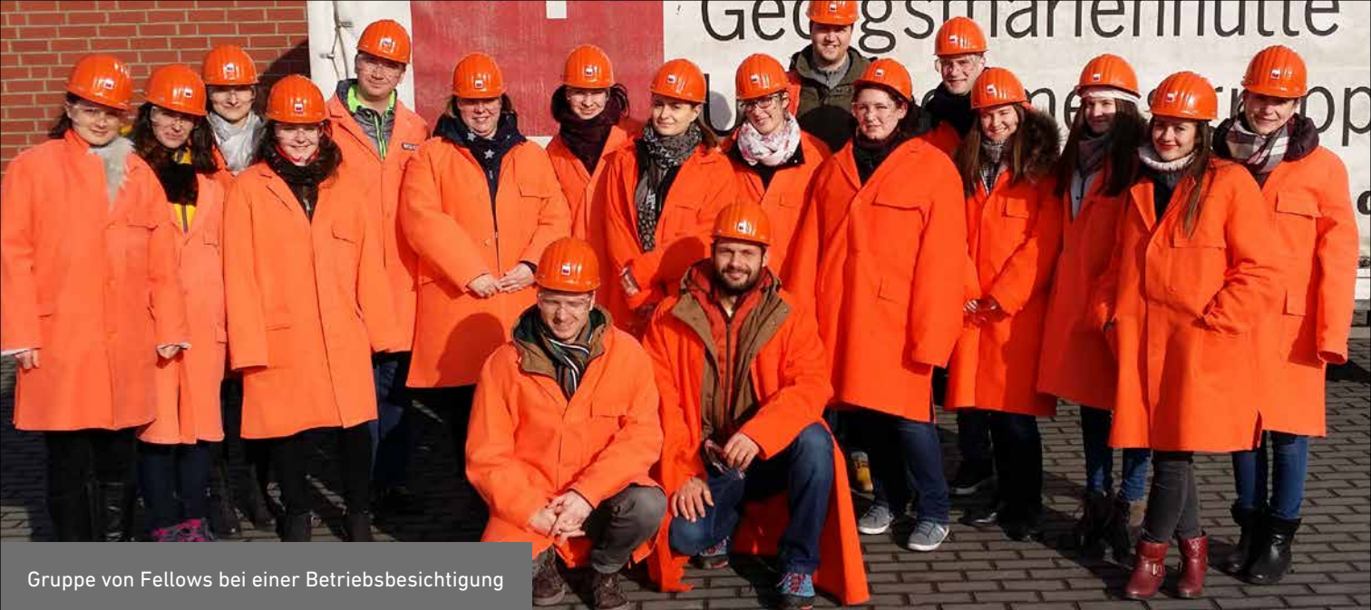
Gruppe von Fellows bei einer Betriebsbesichtigung