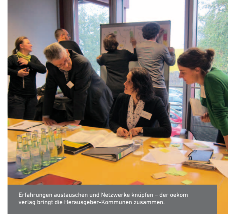
Erfahrungen austauschen und Netzwerke knüpfen – der oekom verlag bringt die Herausgeber-Kommunen zusammen.

Nicht nur Kommunen und Landkreise, auch Unternehmen können ein Klimaschutzbuch herausgeben und damit ihre Mitarbeiter und Kunden für den Klimaschutz gewinnen. In jedem Klimaschutzbuch stehen einige Seiten zur Darstellung des Klimaschutzengagements des Herausgebers zur Verfügung. Das Titelbild und die Inhalte des Klimaschutzbuchs können individuell abgestimmt werden. So profitieren alle Seiten: Kommunen, Landkreise und Unternehmen erhalten ein ansprechendes Instrument zur Öffentlichkeitsarbeit und für ihre Klimaschutz-Strategie. Die Leser profitieren von nützlichen, unterhaltsamen Tipps und von den Gutscheinen. Und die teilnehmenden Geschäfte erhalten positive Aufmerksamkeit und locken neue Kunden.