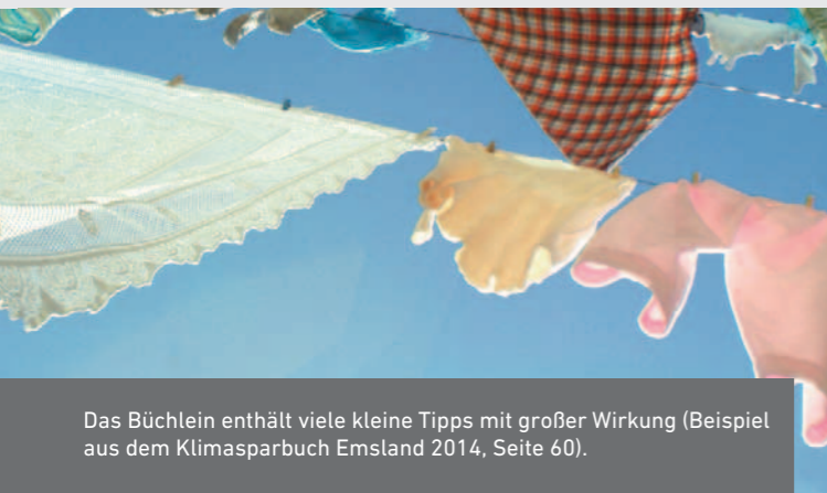
Das Büchlein enthält viele kleine Tipps mit großer Wirkung (Beispiel aus dem Klimaschutz Emsland 2014, Seite 60).