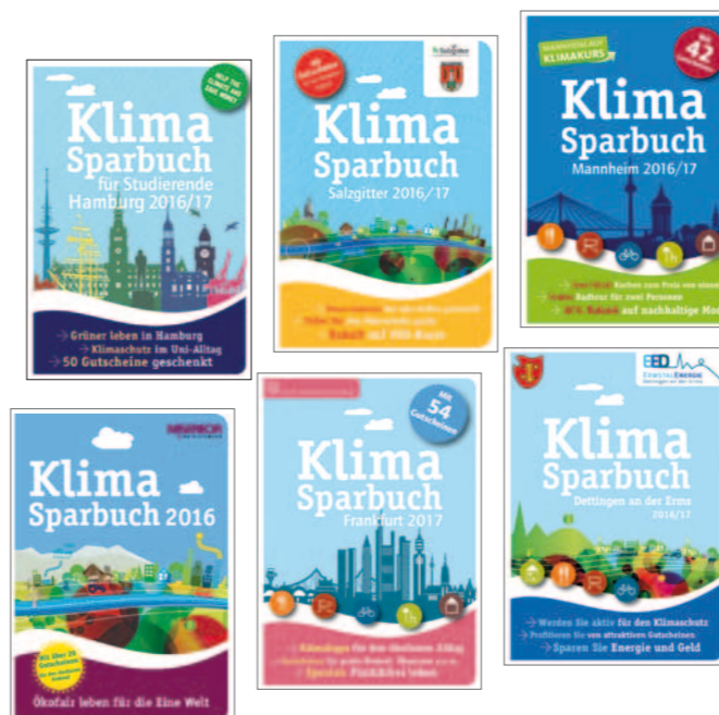
Das Klimaschutzbuch erscheint jährlich in mehreren Kommunen und Regionen. Die aktuellen Ausgaben finden Sie unter www.klimasparbuch.net .

Das Klimaschutzbuch erschien 2010 zum ersten Mal in München und war in den darauffolgenden Jahren auch in anderen großen Städten erfolgreich – zum Beispiel in Stuttgart und Frankfurt. Aufgrund regen Interesses wurde das Konzept in dem von der DBU finanziell geförderten und fachlich begleiteten Projekt erfolgreich an die Bedürfnisse von Landkreisen, ländlichen Regionen und kleineren Kommunen angepasst. Im Rahmen des Modellprojektes arbeitete der oekom verlag eng mit den Standorten Landkreis Emsland, Landkreis Osnabrück, Stadt Rostock und Stadt Schwäbisch Hall sowie bestehenden Klimaschutzinitiativen, wie beispielsweise den kommunalen Klimaschutzkonzepten, zusammen. Die Übertragung auf weitere Regionen ist ausdrücklich erwünscht und durch das bereits vorhandene inhaltliche Grundkonzept einfach und kostengünstig umsetzbar.