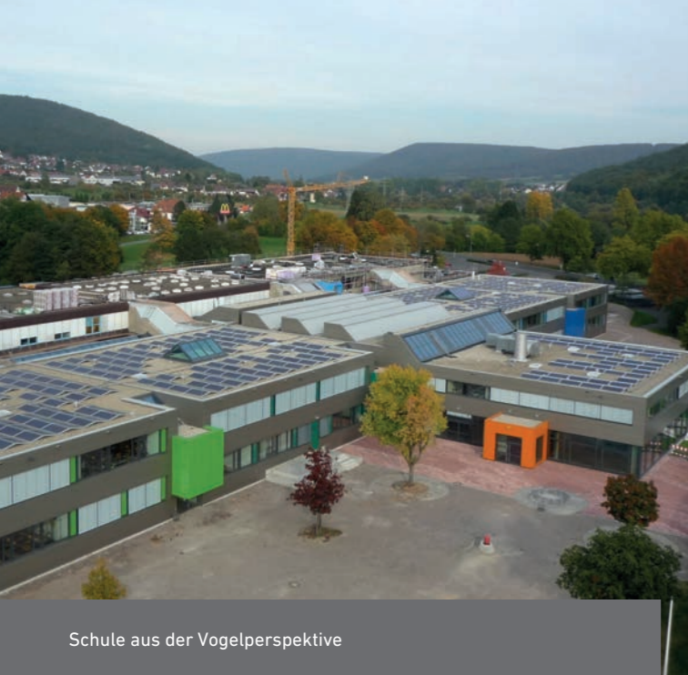
Schule aus der Vogelperspektive