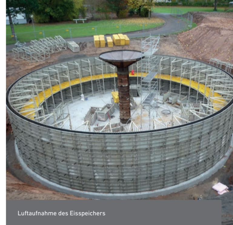
Luftaufnahme des Eisspeichers